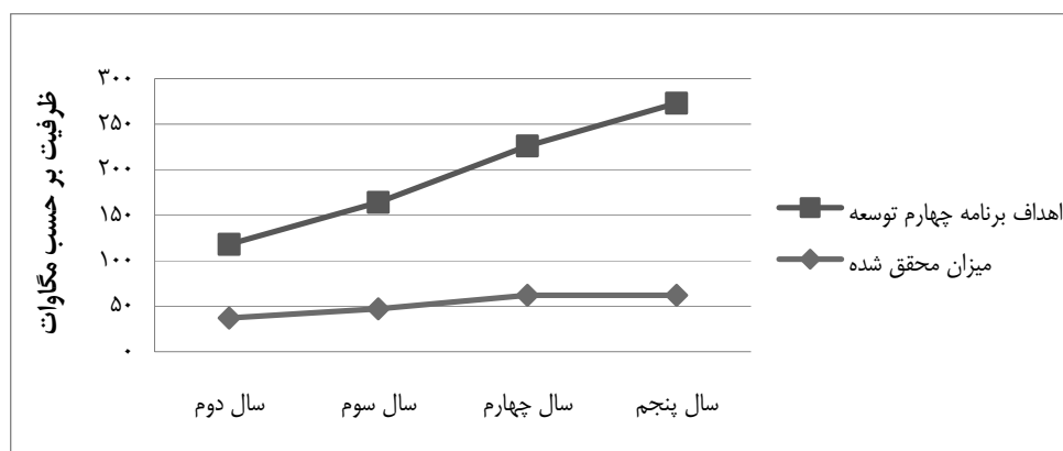
نمودار ۴: میزان تحقق اهداف برنامه چهارم توسعه در زمینه احداث عملی نیروگاه‌های تجدیدپذیر

در نمودار (۴) نیز که میزان تحقق اهداف برنامه چهارم توسعه در زمینه احداث عملی نیروگاه‌های تجدیدپذیر را به زبان ساده با استفاده از خطوط شیبدار بیان می‌کند، فاصله زیاد اهداف تعیین شده و اهداف محقق شده به وضوح مشخص است.